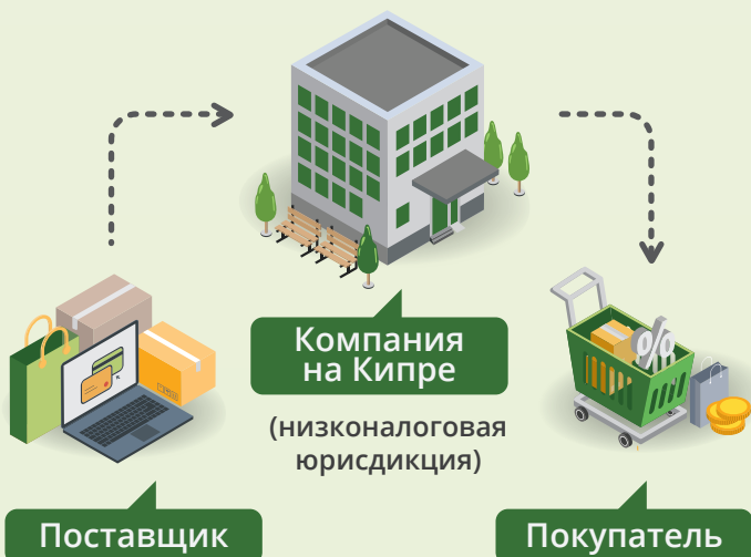
Схема 1: Поставщик продает компании на Кипре товар себестоимостью в 100$ по цене 101$, компания на Кипре продает товар по цене 110$ непосредственно покупателю. Прибыль, возникающая в результате операции, накапливается в офшорной компании, свободная от каких-либо налогов.

Чтобы платить меньше налогов, вы можете захотеть использовать офшорные фирмы для сделок по экспорту/импорту; в качестве холдинга; для выплаты дивидендов компании; для владения авторскими правами, торговыми марками, патентами, другой интеллектуальной собственностью и получения лицензионных выплат (роялти); для выдачи кредитов и т.д.