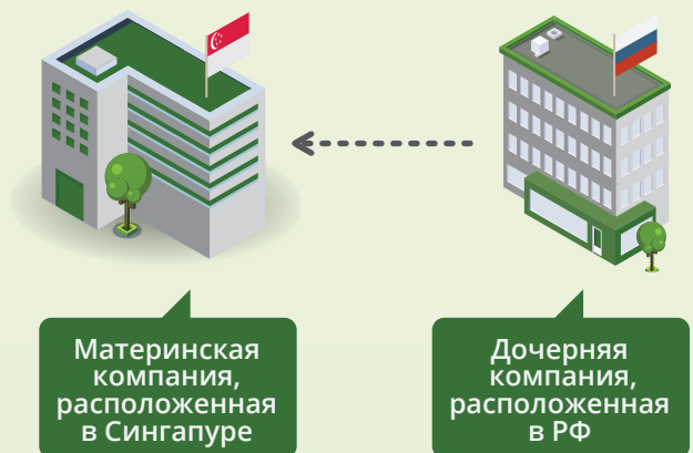
Схема 2: Дочерняя компания – резидент РФ выплачивает дивиденды материнской компании – нерезиденту.

Схема 1: Поставщик продает компании на Кипре товар себестоимостью в 100$ по цене 101$, компания на Кипре продает товар по цене 110$ непосредственно покупателю. Прибыль, возникающая в результате операции, накапливается в офшорной компании, свободная от каких-либо налогов.