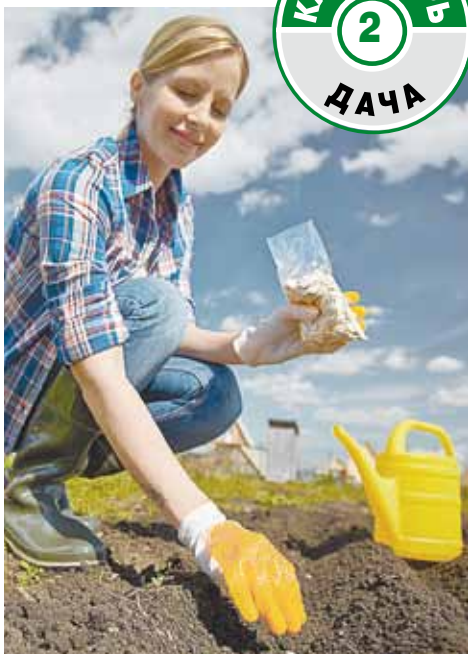
Для многих майские праздники - настоящие трудовые.

В ЦВЕТНИКАХ: уберите сухие стебли и мусор. «Вычешите»